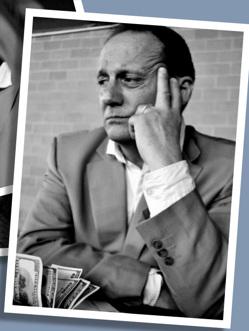
Imatges d'assaig